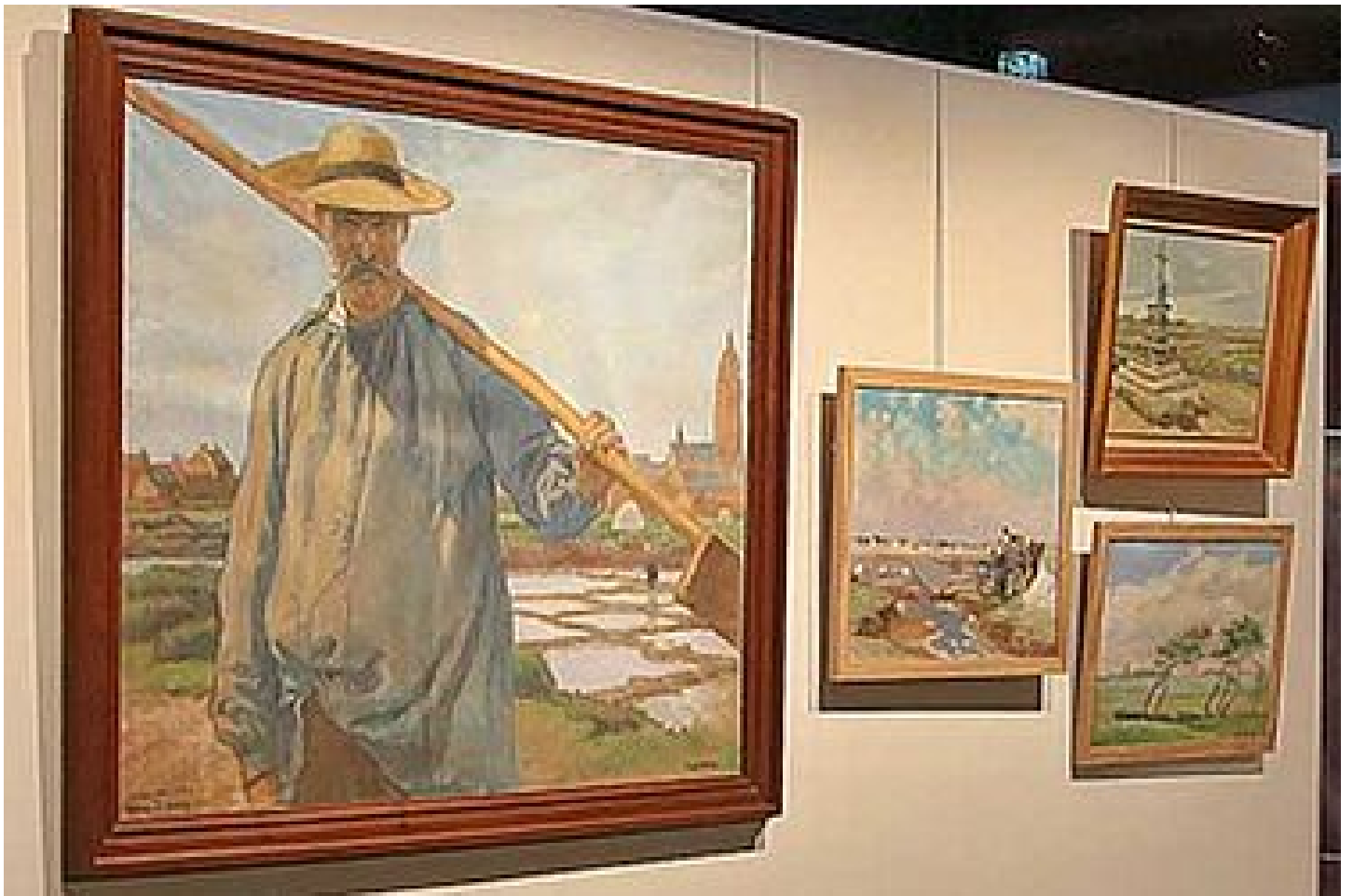
Les arts graphiques