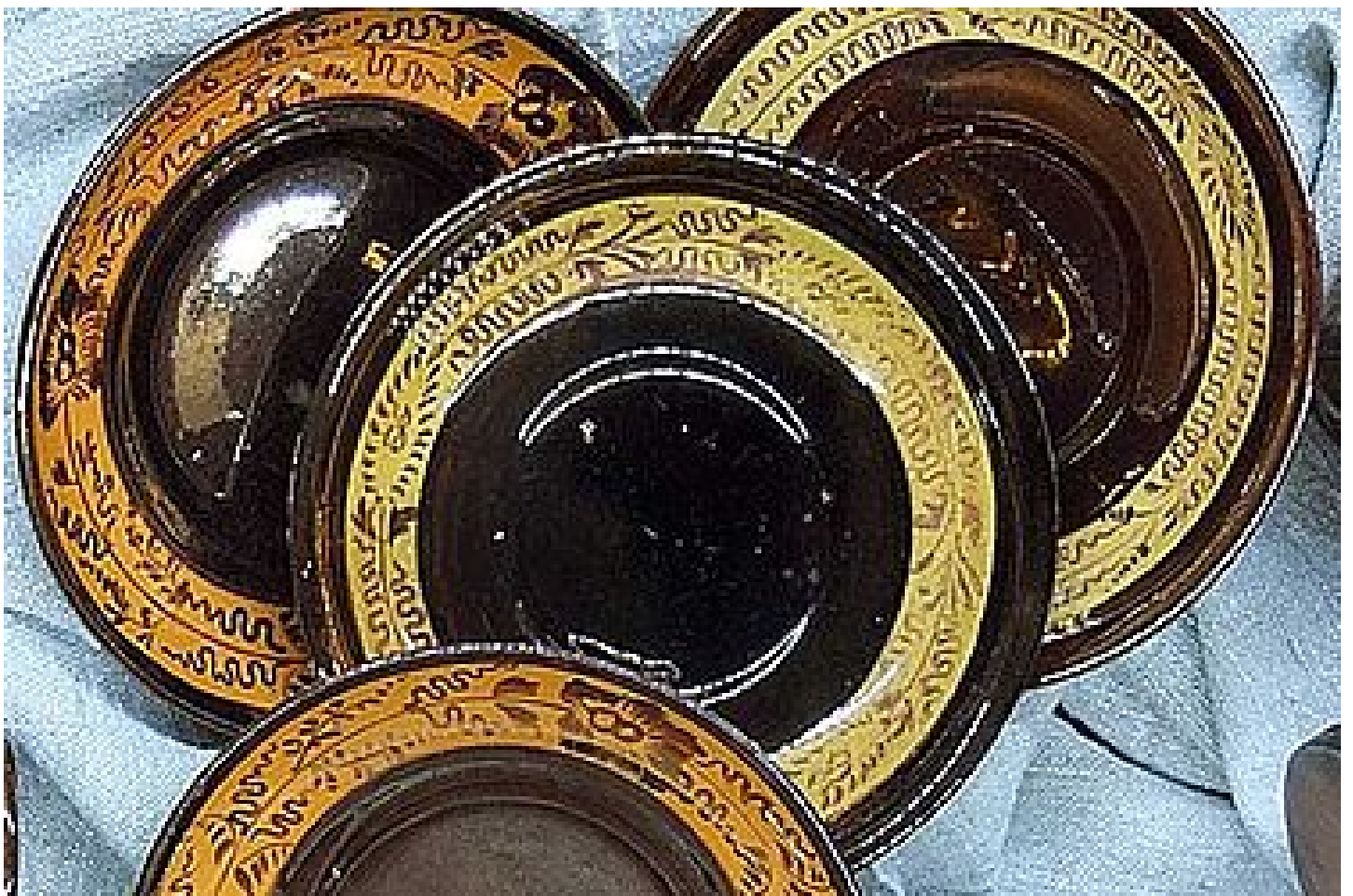
Les arts décoratifs

https://www.museedesmaraisalants.fr/le-musee/les-collections